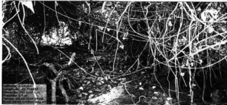
Figura 06: APA Nascente dos Milagres

Localidade: 0.042047 Longitude: -42.708887 Elevação: 250,41411 m Precipitação: 2,0 m Tempo: 03/02/2023 09:08 Nota: Santo Antônio dos Milagres - Piauí - Brasil Data: 03/02/2023