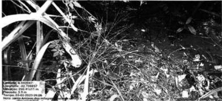
Figura 05: APA Nascente dos Milagres

Localidade: 0.042047 Longitude: -42.708887 Elevação: 250,41411 m Precipitação: 2,0 m Tempo: 03/02/2023 09:08 Nota: Santo Antônio dos Milagres - Piauí - Brasil Data: 03/02/2023