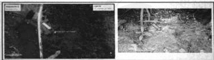
Figura 01: UC APA Santo Antonio dos Milagres em Santo Antonio dos Milagres-PI.

O Unidade de Conservação Ambiental está localizada na área urbana, no centro, da cidade, nas seguintes coordenadas 6°2'31.16"S 42°42'31.52"W, na cidade de Santo Antonio dos Milagres -PI, sendo constituída por densa área de mata ciliar compreendendo uma faixa de 0,716 hectares de extensão territorial sendo berçário de espécies da flora nativa e de fauna silvestre do Cerrado e da Caatinga. O acesso a APA se dá pela 'Avenida/Rua/Estrada' descrever o acesso, que interliga a cidade de Santo Antonio dos Milagres a local da APA (Figura 01).