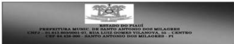
Figura 1. Localização do município de Santo Antônio dos Milagres no estado do Piauí.