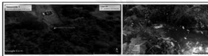
Figura 2. Localização da nascente Cacimba dos Araújos do Brejinho.

Foi encontrado presença de animais, ausência (parcial) de mata ciliar e uso da terra ao redor da nascente como pastagens e para agricultura.